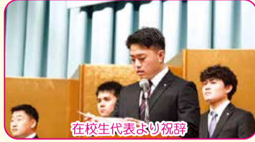
在校生代表より祝辞