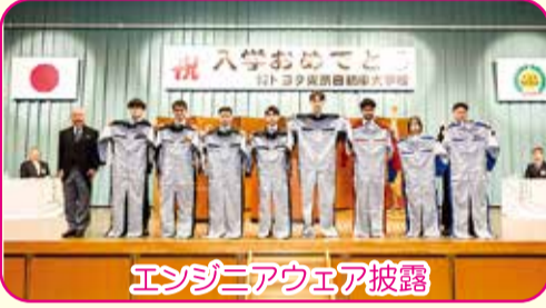
エンジニアウェア披露