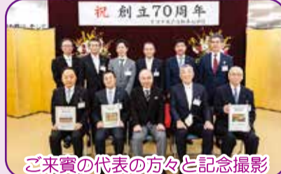
ご来賓の代表の方々と記念撮影

トヨタ東京自動車大学校は今年で創立70周年となりました。入学式同日に日ごろよりお世話になっている所轄官庁、関係各社の方々をお招きして記念式典を開催し、当校の発展に向け様々なご寄付・ご支援をいただくことができました。ご寄贈いただいた大型モニターは既に授業で活用されています。今後も関係各社の方々のご協力のもと、より良い教育を目指してまいります。ご協賛いただきまして誠にありがとうございました。